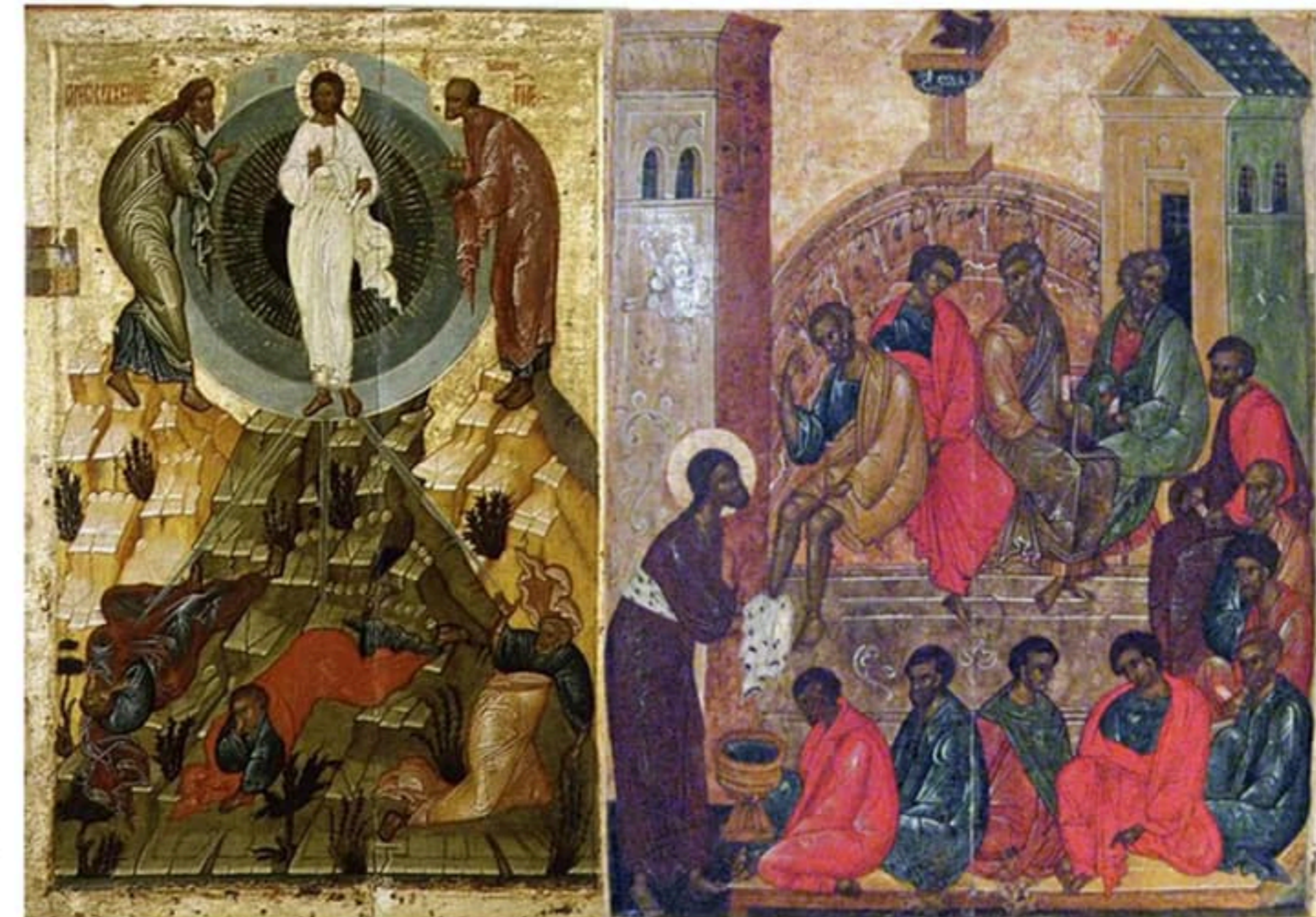
Mga icon ng Russia mula sa ika-17 siglo - si Kristo kasama ang mga alagad

- Kung gusto nating makatakas sa mga ito isinumpang sitwasyon at upang tanggapin ang Kaharian sa Langit, dapat tayong magsisi at sumunod ng mga Batas ng Diyos. ( Deuteronomio 30:1-3 )