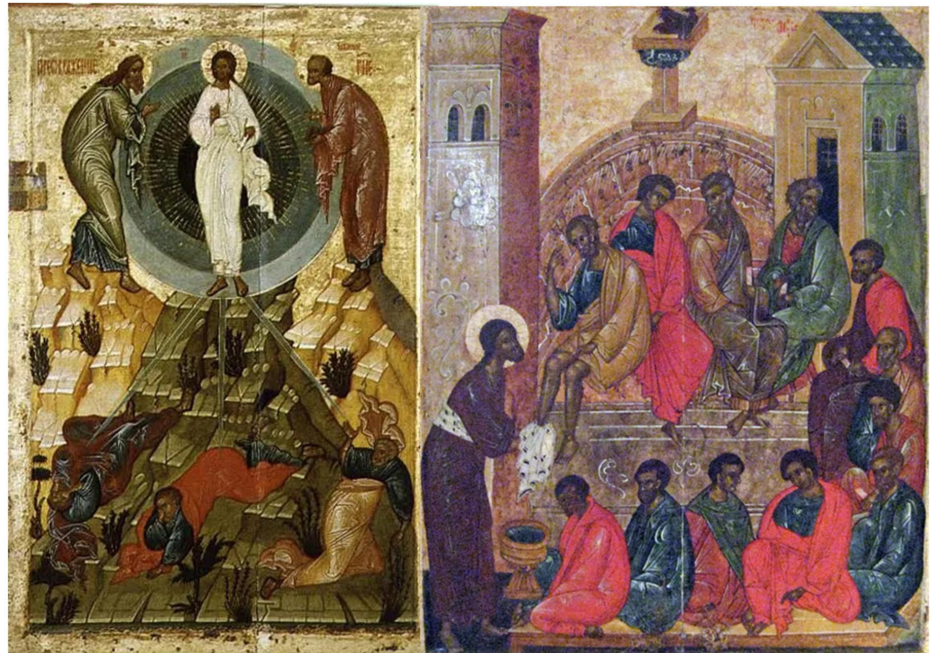
Russian Icons from the 17th Century - Christ with the disciples

- If we wish to escape these cursed conditions and receive The Kingdom of Heaven, we must repent and keep God's Laws.(Deuteronomy 30:1-3)